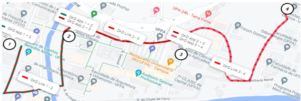
Figura 1. Rede QKD proposta para o Campus da UFPA no simulador OpenQKD

a diversos dispositivos QKD disponíveis no mercado. Assim, é o sistema ideal para servir como base para o projeto da rede QKD proposto.